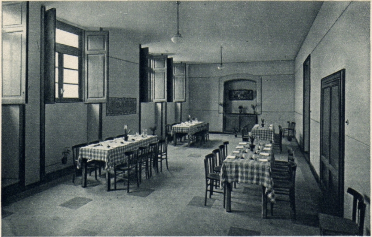
PARTICOLARE DEL REFETTORIO