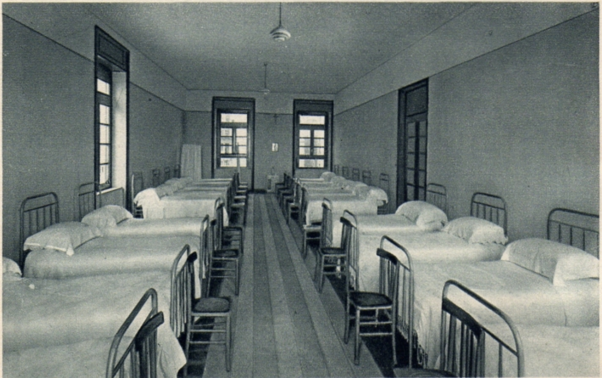
UNO DEI DORMITORI