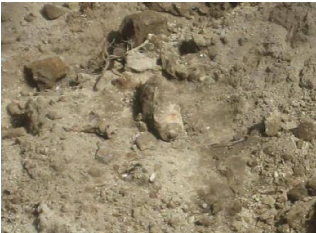
La bomba ritrovata nel cantiere di Via Rafastia

Si sfiorò una tragedia, gli sfollati furono accolti in scuole, strutture sanitarie e all'interno dello stadio Vestuti; fu necessario attendere 144 ore dal ritrovamento, in quanto la pala meccanica che aveva toccato la bomba, avrebbe potuto attivare un meccanismo d'innesco chimico, che aveva, appunto, un tempo massimo di funzionamento di 144 ore.