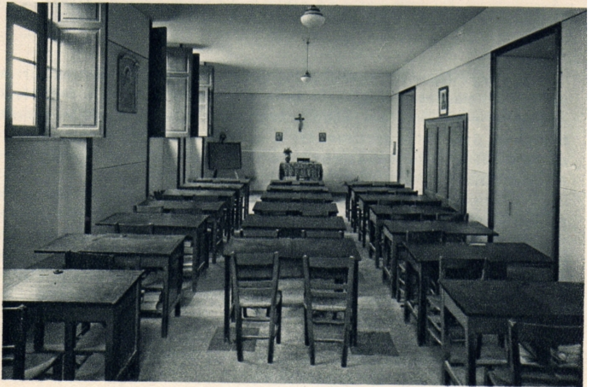
UN' AULA DI STUDIO